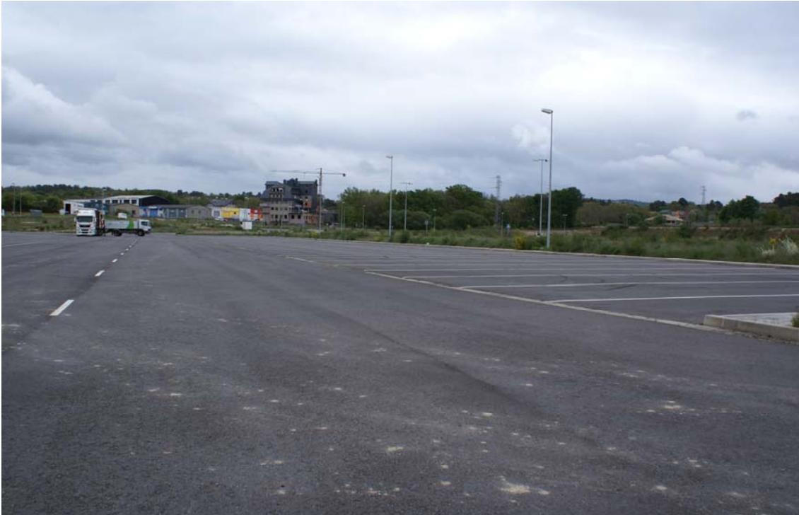
Estacionamiento de vehículos pesados