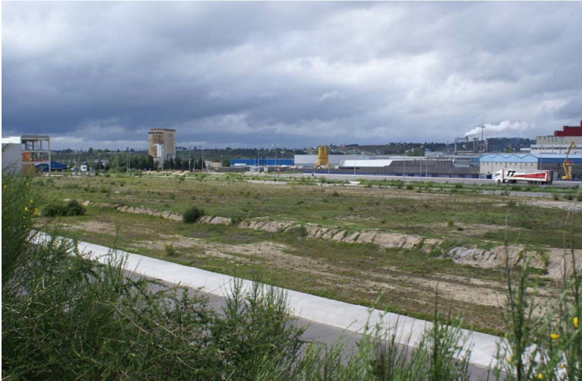
Futuro Bloque de parcelas