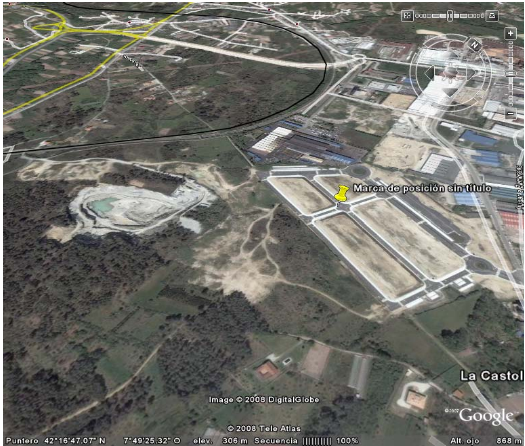
Foto: Ubicación de la central do transporte